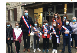
Ecole Notre Dame